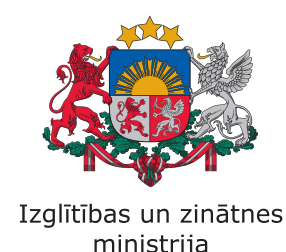
Izglītības un zinātnes ministrija