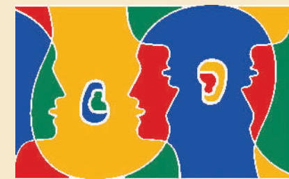
Eiropas Valodu dienu organizācija