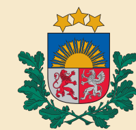
Latviešu valodas aģentūra