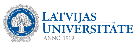
LATVIJAS UNIVERSITĀTE ANNO 1919