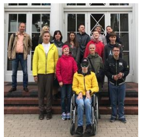
Audzināmās klases skolēni ar vecākiem