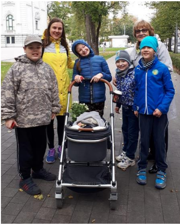
Raksta autors: skolotāja Mārīte Teivāne